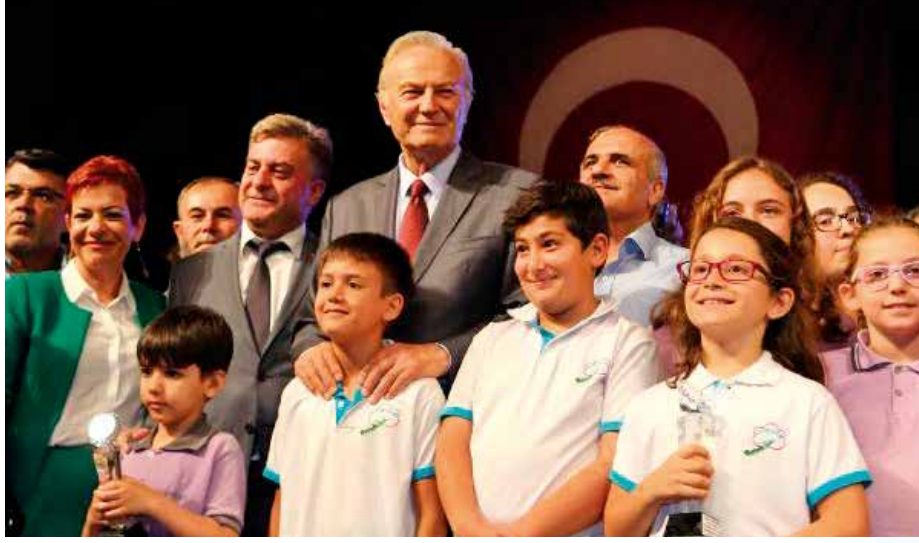
4. Genç Çınarlar Kısa Film Yarışması / Onur Konuğu Ediz HUN Sinema Sanatçısı